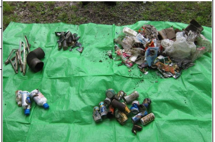
写真1 収集ゴミの写真

〔手前左〕 プラ容器 〔手前右〕 空き缶 〔奥左〕 金属品・金属管 〔奥中〕 ガラス瓶・破片 〔奥右〕 プラ・ビニール・紙・布の各ゴミ