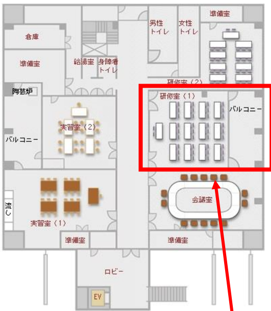
パストラルかぞ 平面図 2階